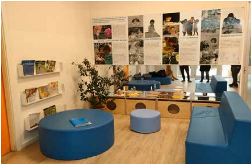
Figure 1- Lo spazio del Nido d'Infanzia Le Betulle allestito per svolgere le interviste

È a partire dall'analisi di questi bisogni che ha preso forma la seconda parte