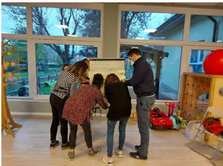
Figure 3 - Il brainstorming iniziale del percorso di confronto tra i genitori

Tirocinanti e studentesse di Programmazione e Gestione dei Servizi Sociali Università degli Studi di Parma