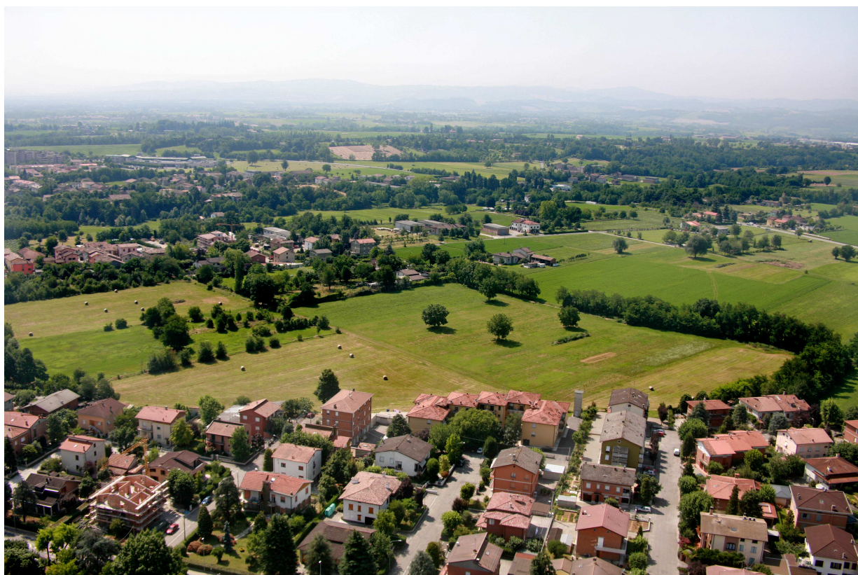
FOTO 6 vista aerea da nord.