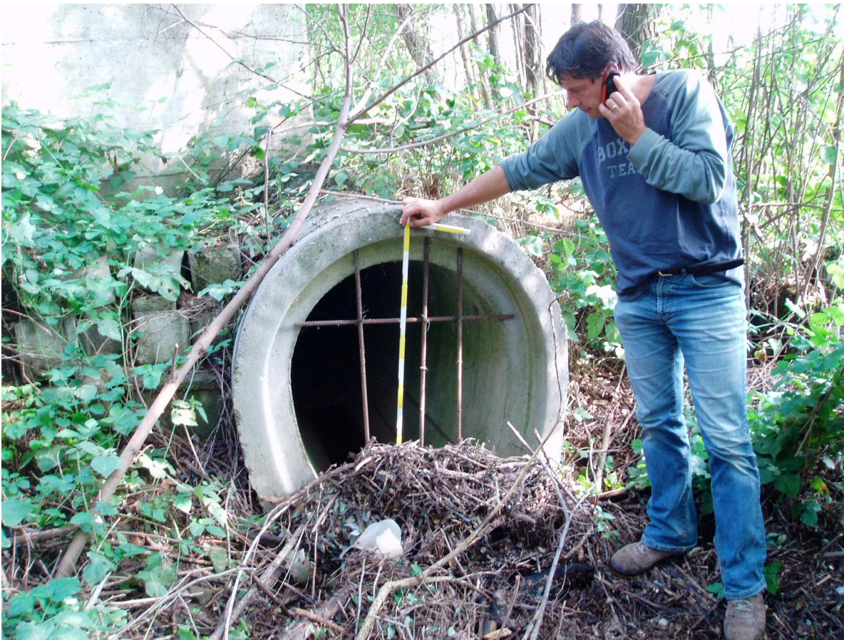
FOTO 30 video ispezione del rio Veta tombato. Imbocco tombamento.