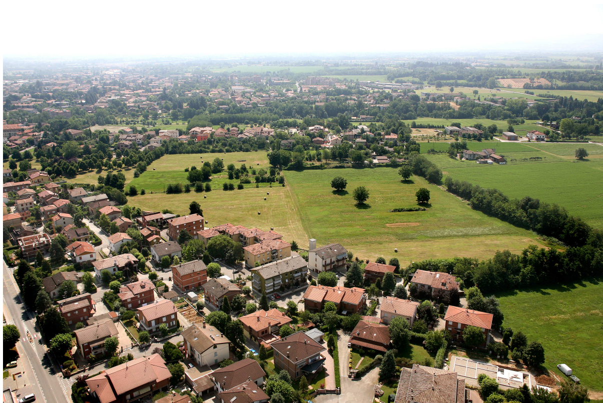
FOTO 2 vista aerea da ovest.