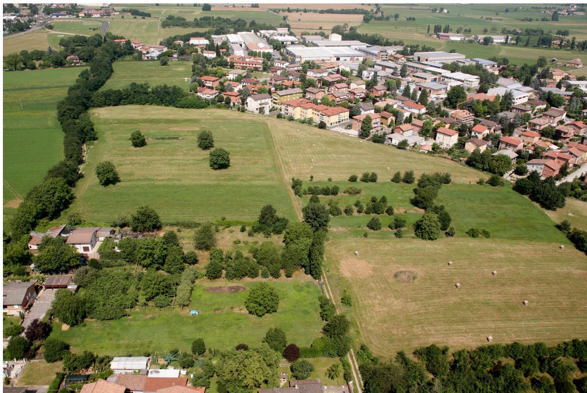
FOTO 5 vista aerea da est.