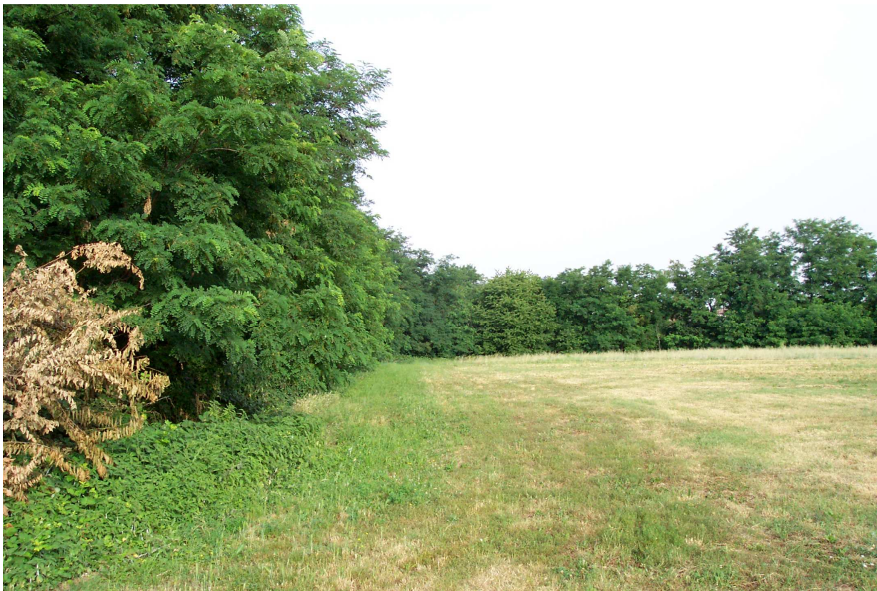
FOTO 11 vista dell'area angolo via Barboiara rio Veta.