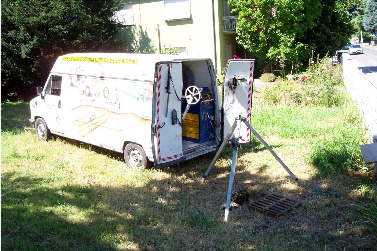
FOTO 23 video ispezione del rio Veta tombato. Tratto a sud di via Rivasi.