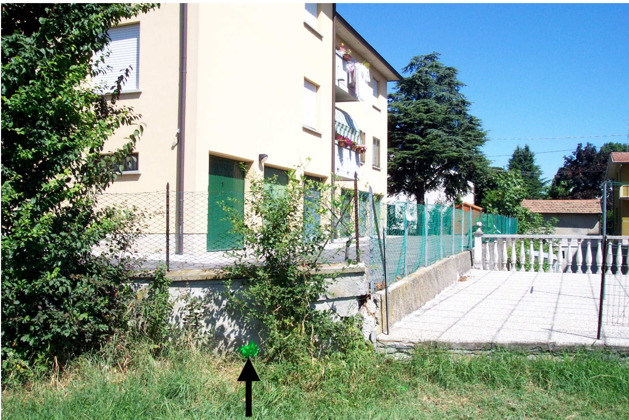
FOTO 28 video ispezione del rio Veta tombato. Posizioni rilevate non ispezionabili.