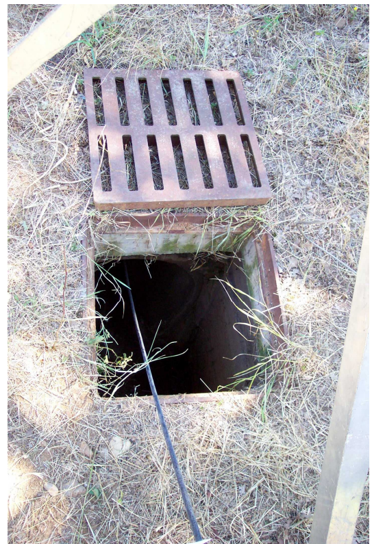
FOTO 26 video ispezione del rio Veta tombato. Pozzetto d'ispezione a sud di via Rivasi.