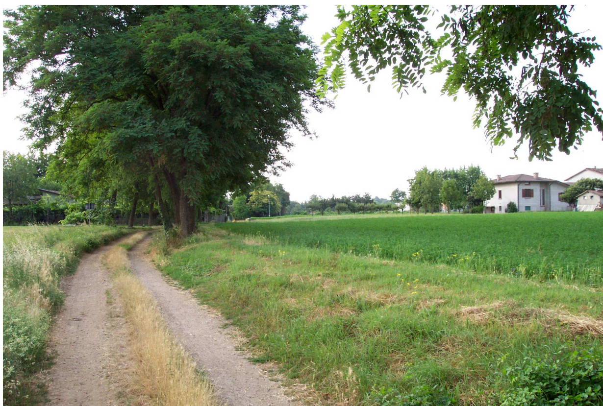
FOTO 8 vista di via Barboiara da ovest verso est, zona centrale.