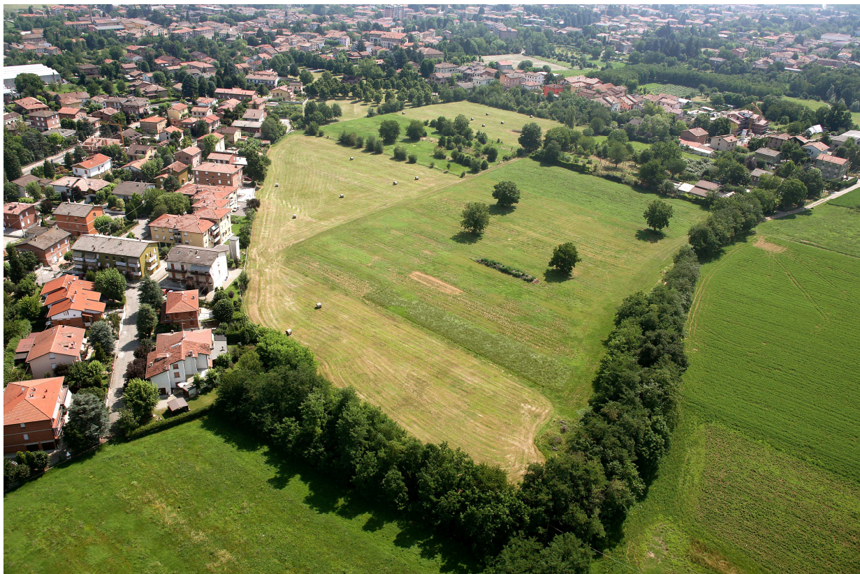
FOTO 3 vista aerea da sud-ovest