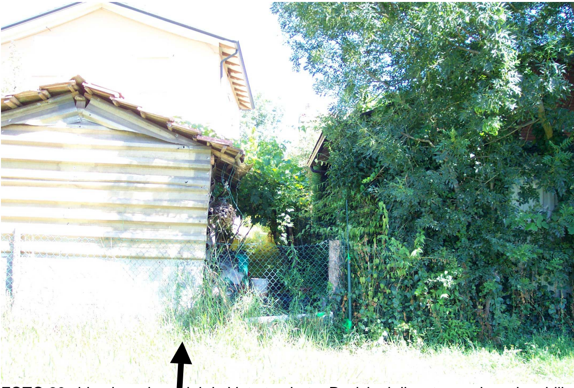
FOTO 29 video ispezione del rio Veta tombato. Posizioni rilevate non ispezionabili.