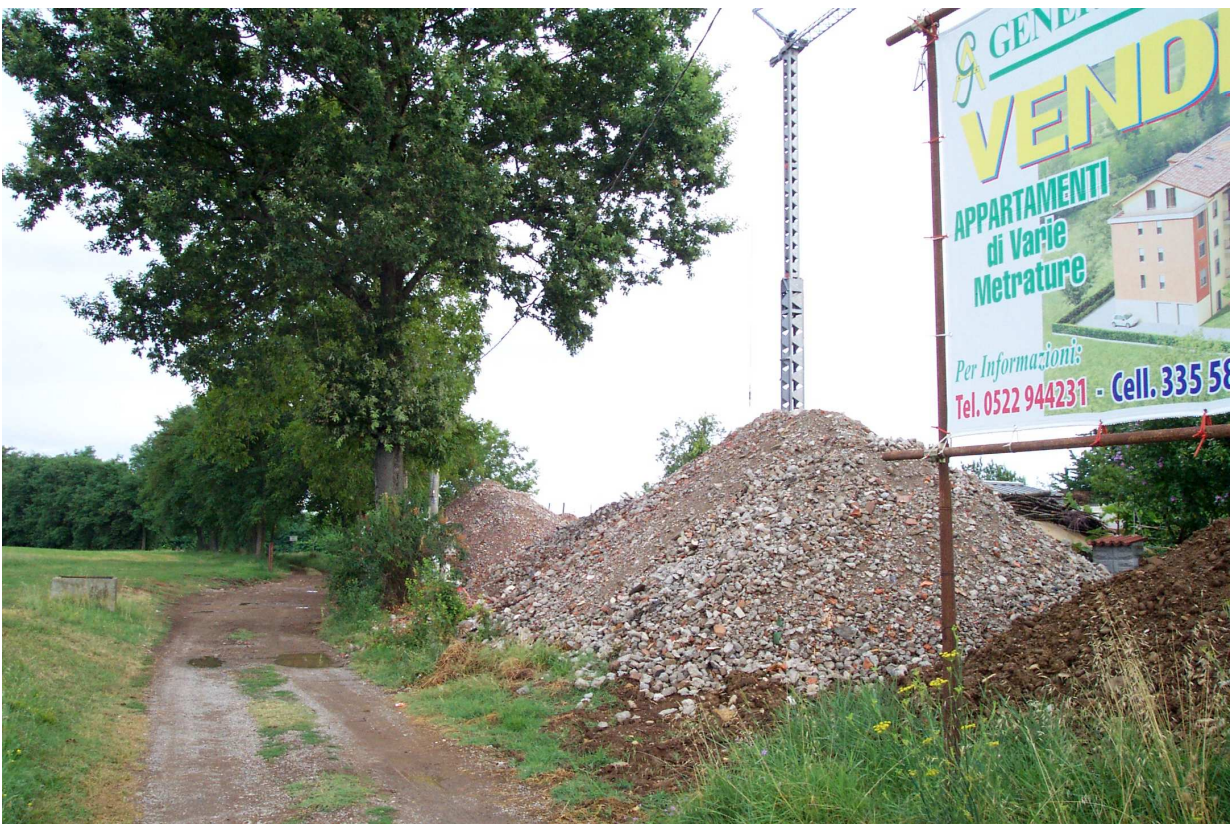
FOTO 18 vista di via Barboiara tratto iniziale da via Roncaglio verso ovest.