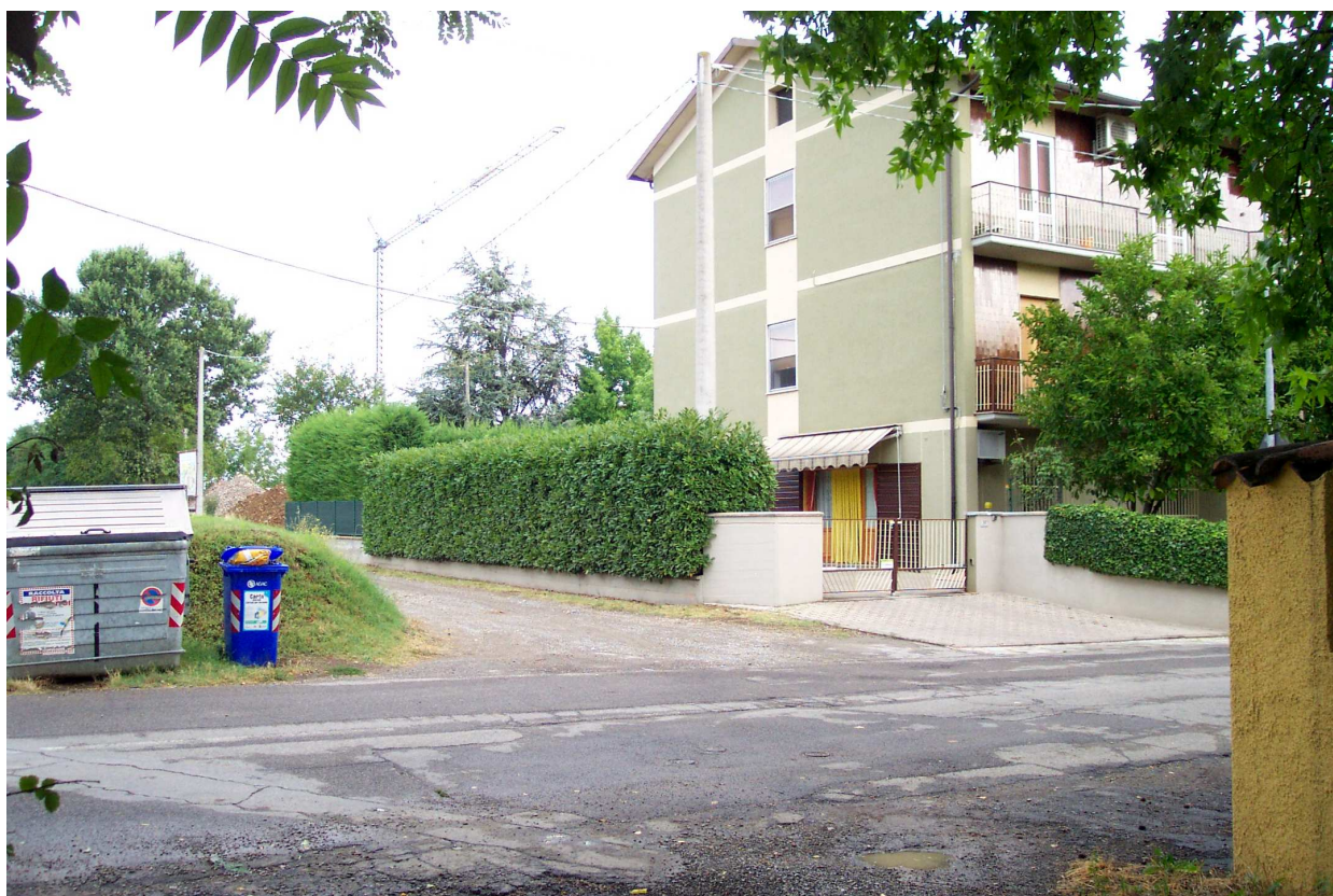
FOTO 20 vista di via Roncaglio innesto via Barboiara verso ovest.