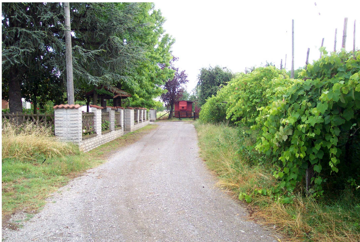
FOTO 19 vista di accesso privato su via Barboiara verso nord.