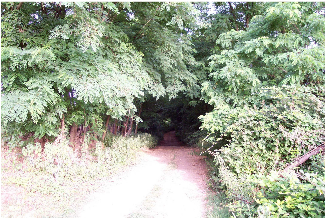
FOTO 10 di via Barboiara da est verso ovest, zona rio Veta.