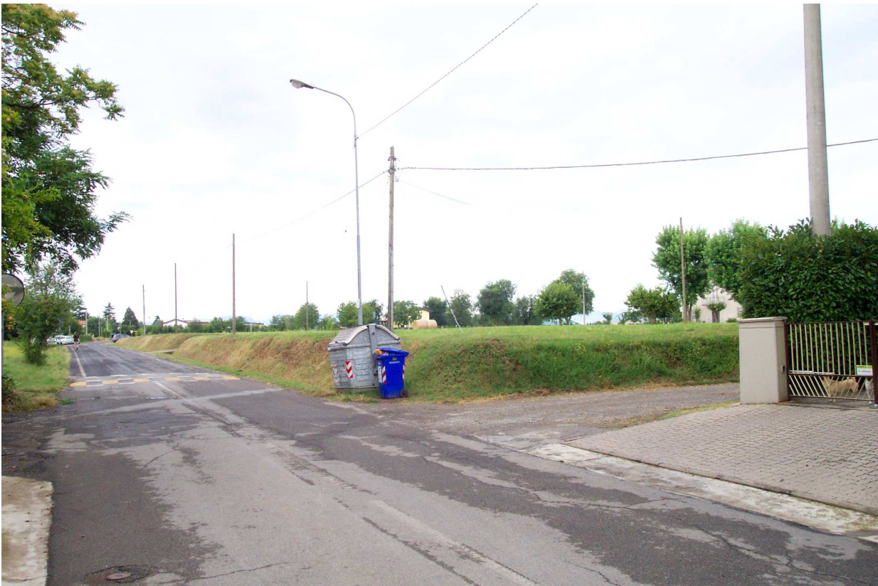
FOTO 22 vista di via Roncaglio all'altezza di via Barboiara verso sud.