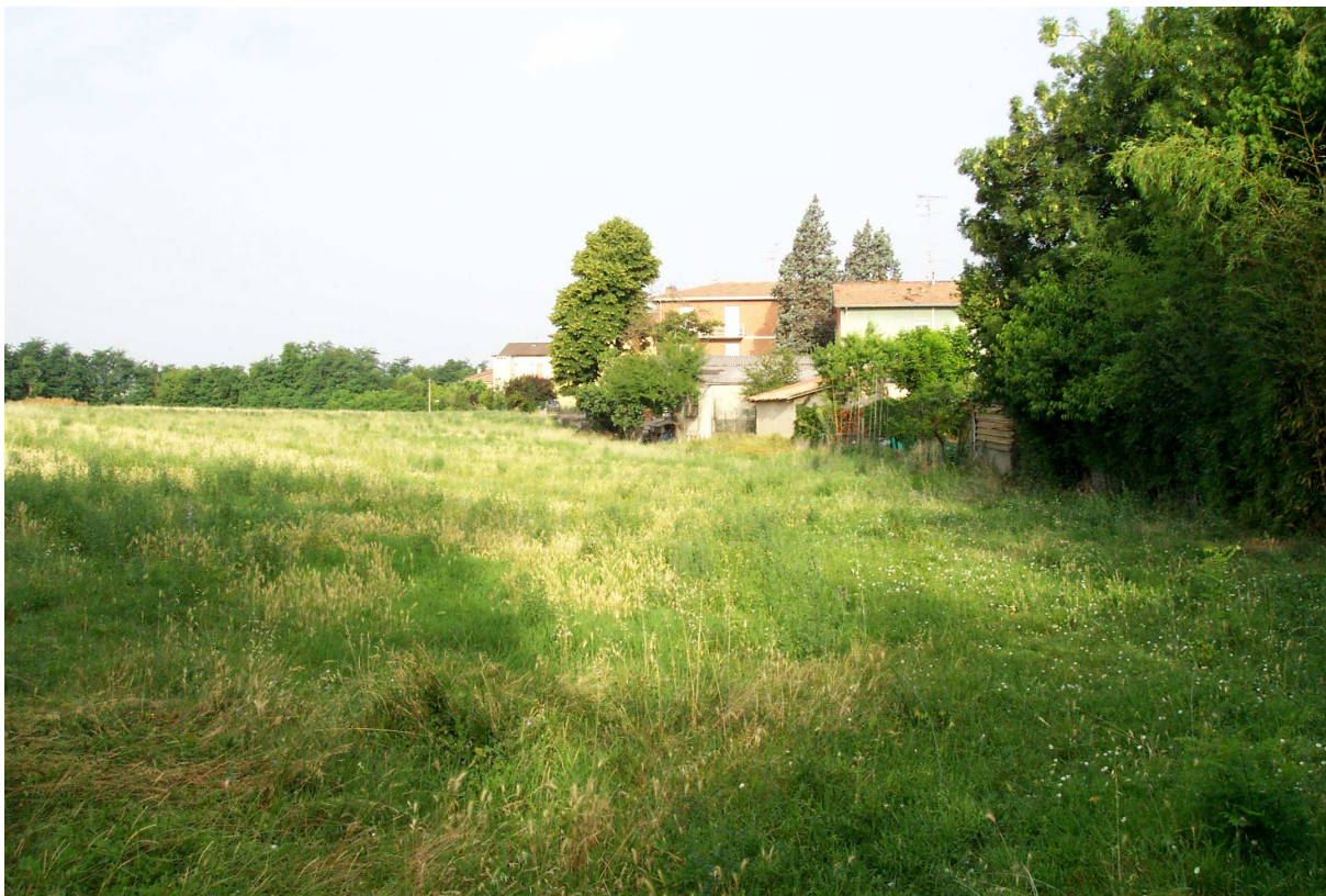
FOTO 16 vista dell'area d'intervento da ovest verso est.