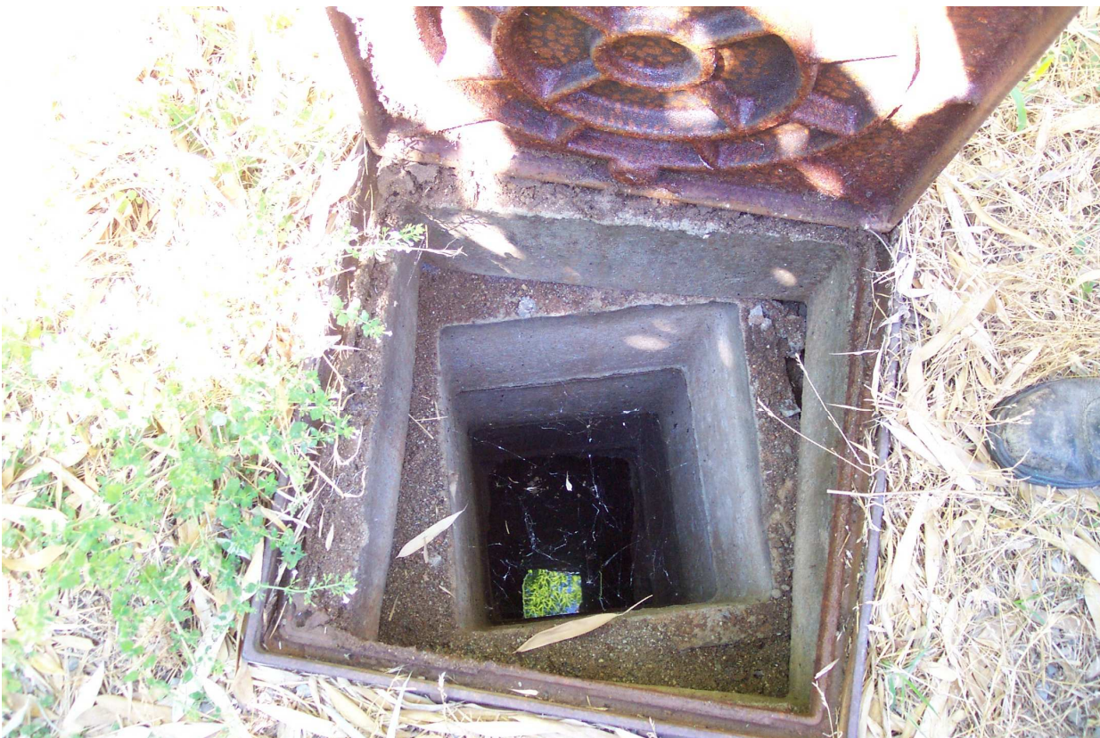
FOTO 24 video ispezione del rio Veta tombato. Pozzetto d'ispezione.