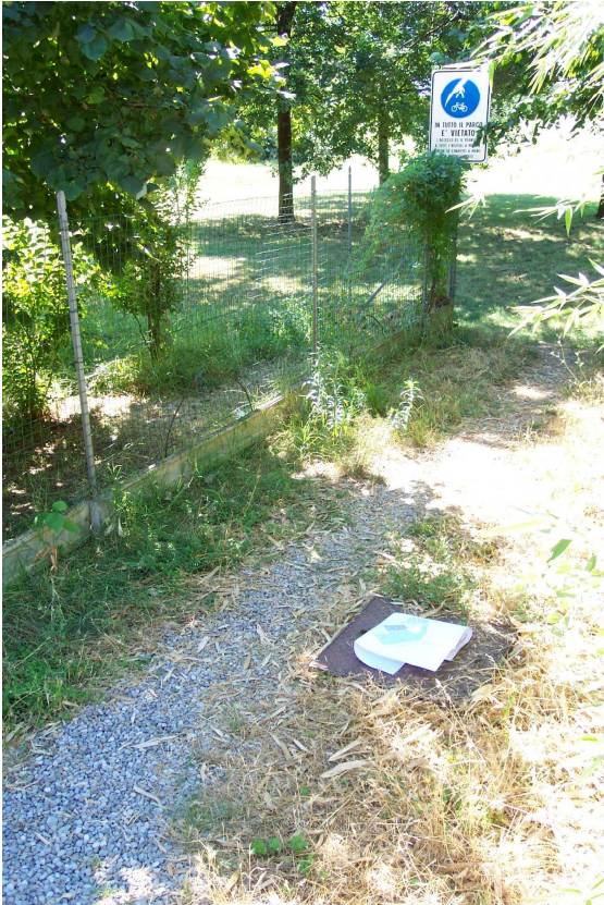
FOTO 25 video ispezione del rio Veta tombato. Pozzetto d'ispezione.