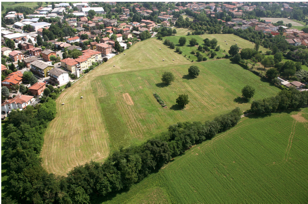
FOTO 4 vista aerea da sud.