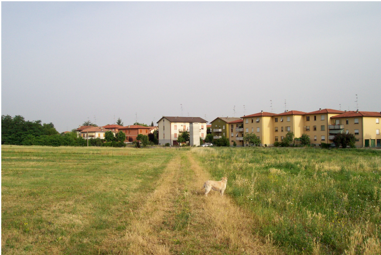
FOTO 12 vista dell'area d'intervento da est verso ovest.