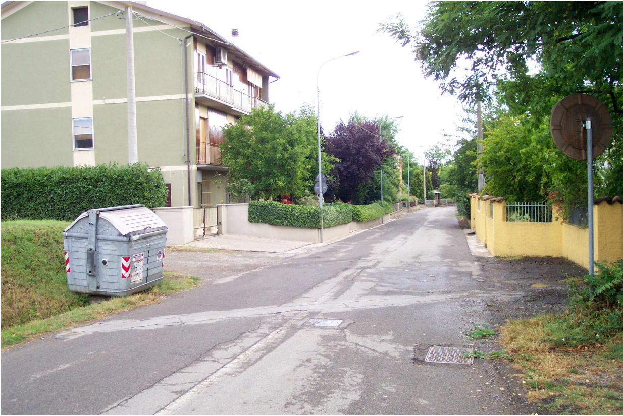
FOTO 21 vista di via Roncaglio all'altezza di via Barboiara verso nord.