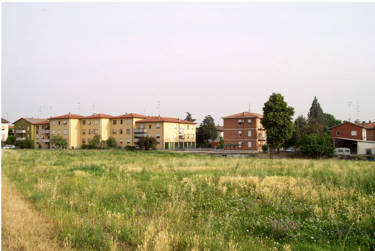
FOTO 13 vista dell'area d'intervento da est verso nord-ovest.