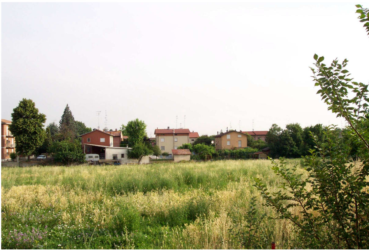
FOTO 14 vista dell'area d'intervento da est verso nord.