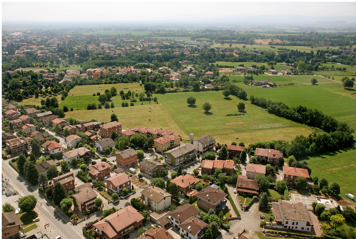
FOTO 1 vista aerea da nord-ovest.