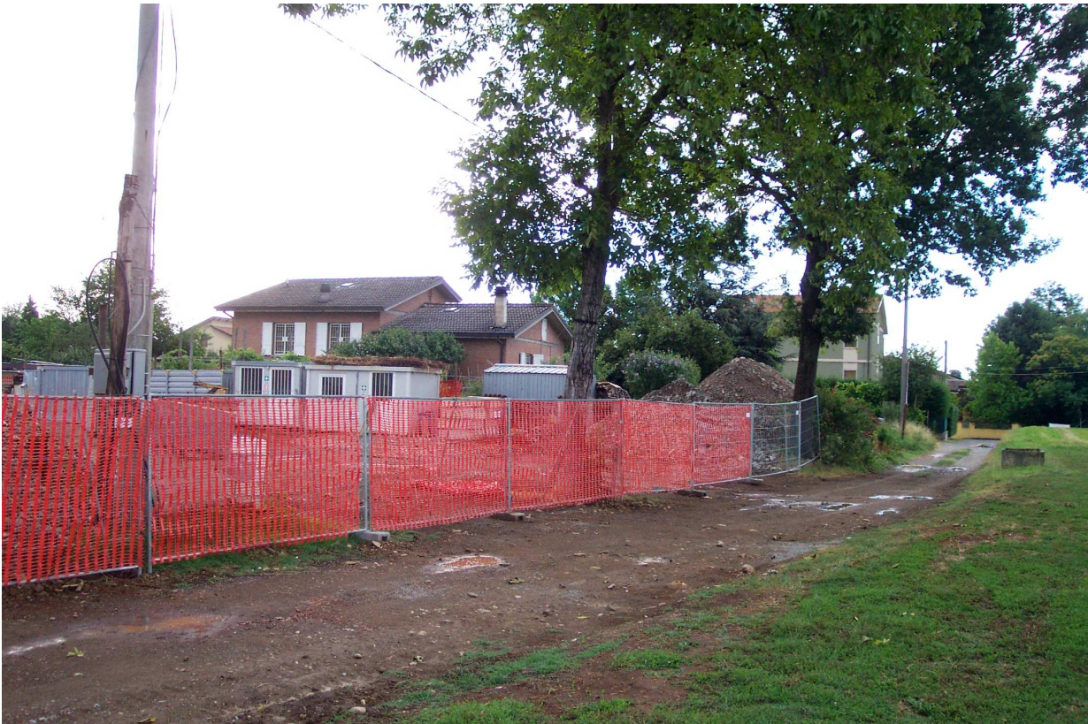
FOTO 17 vista di via Barboiara tratto iniziale da via Roncaglio verso est.