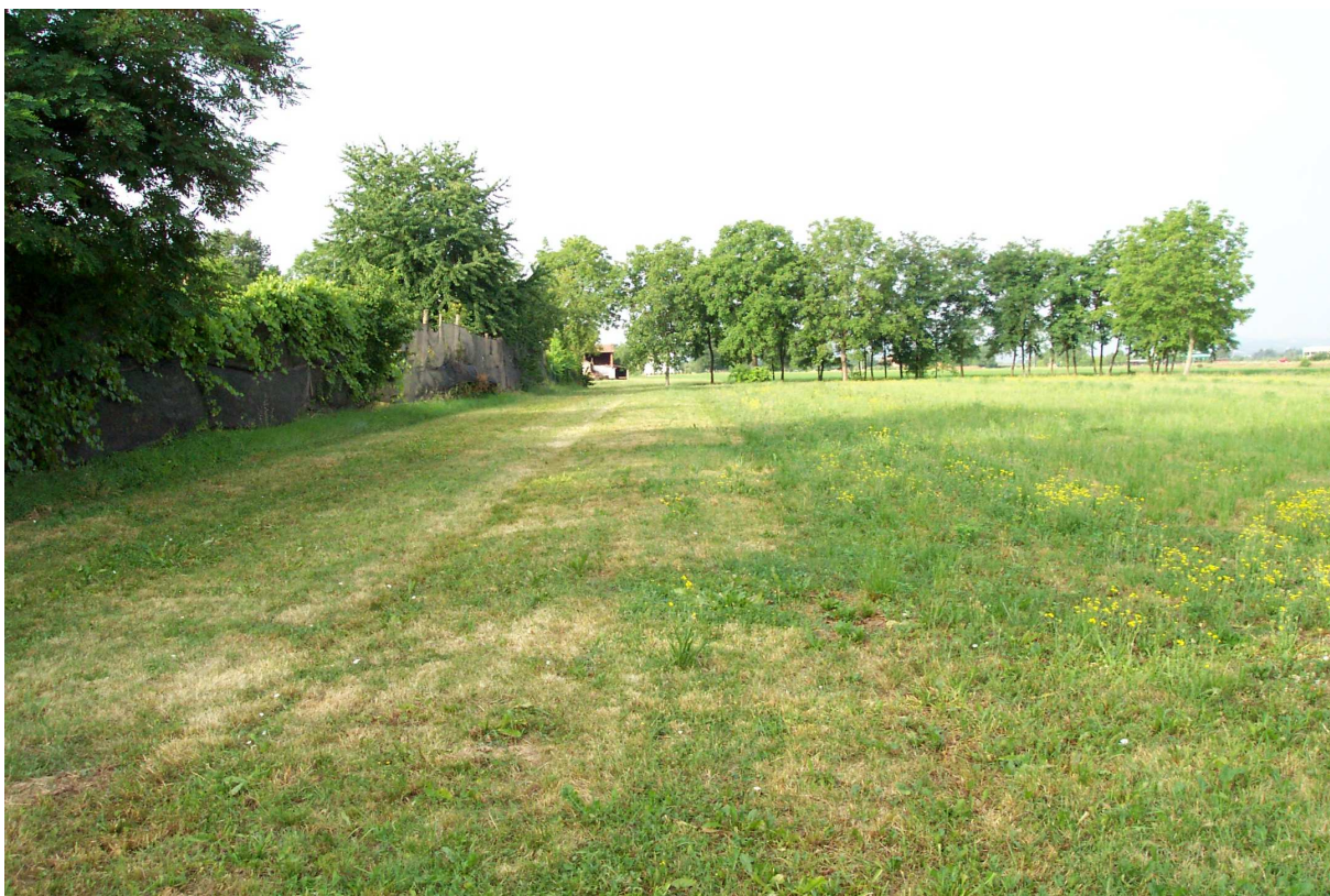
FOTO 15 vista dell'area d'intervento da nord verso sud.