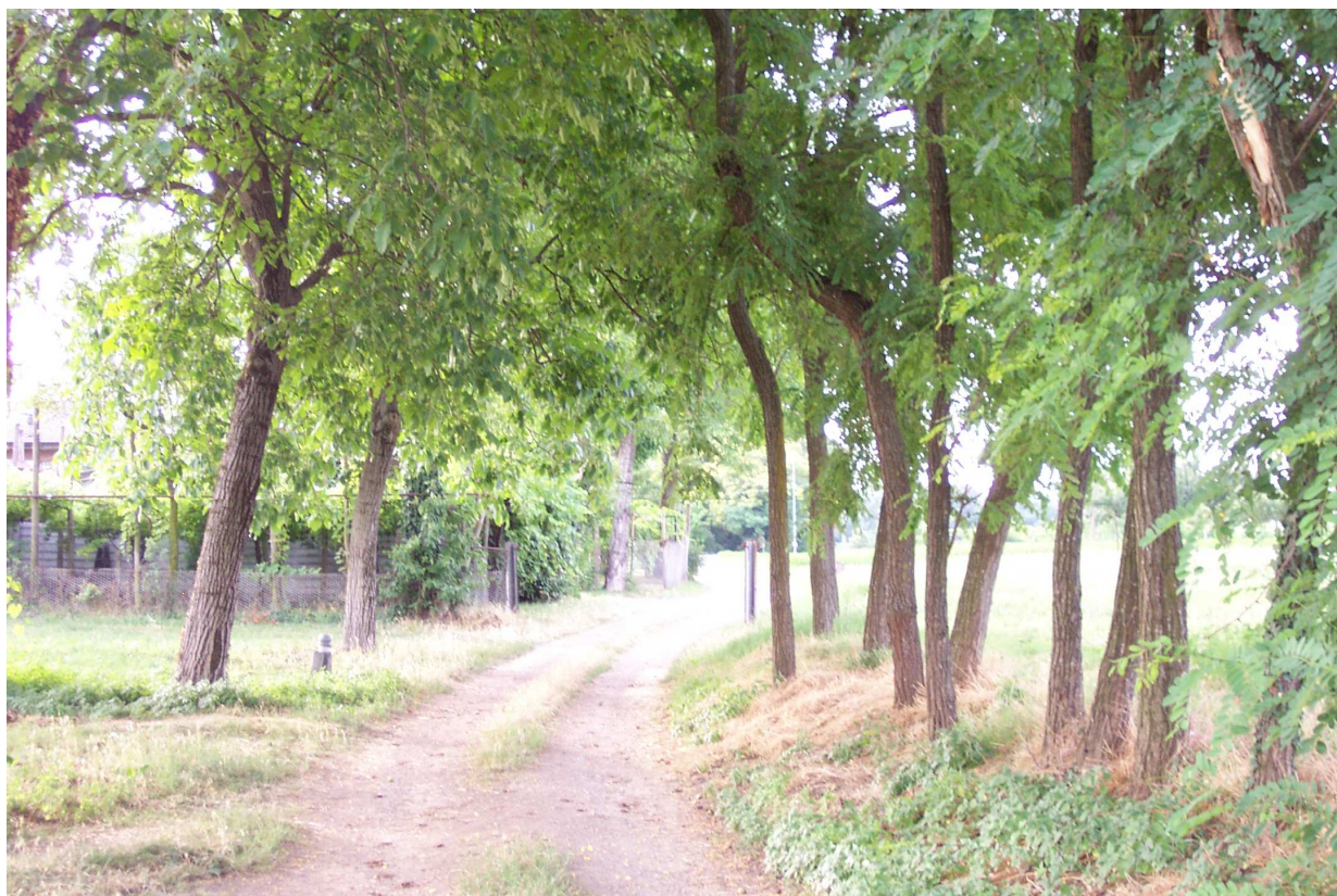
FOTO 7 vista di via Barboiara da ovest verso est, zona via Roncaglio.