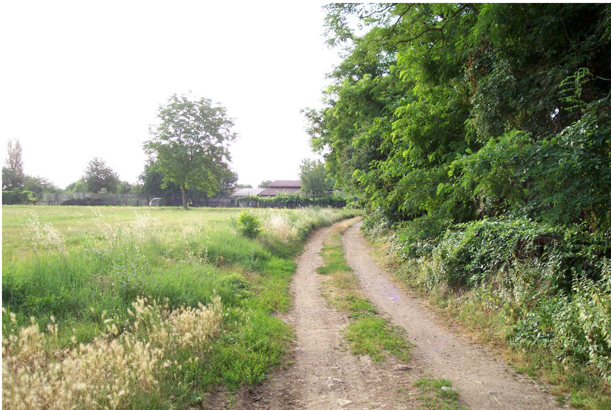
FOTO 9 vista di via Barboiara da ovest verso est.